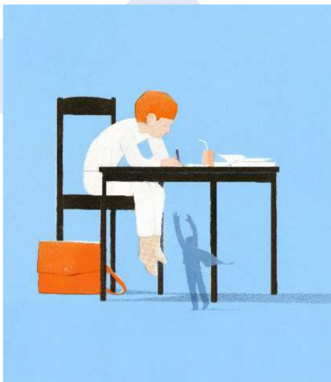
Beeld van de tentoonstelling